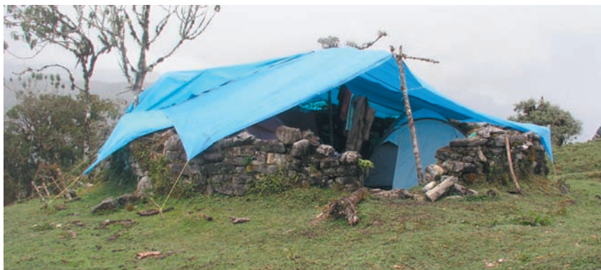
Photographie 4: Les tentes, installées dans d'anciennes structures de pierres chachapoyas, ont été recouvertes par des bâches.

Devant la détresse du groupe « Inti Machay 2014 » et la menace de pénurie,