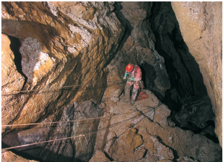
Photographie 16 : Les manipulations de cordes et la pose des Spits prennent énormément de temps. Devant l'état de fatigue avancé des équipes, il est décidé de renoncer à l'extraction et de remettre à plus tard le brancardage du blessé. Trois cordes indépendantes sont installées: la corde dite tyrolienne devant servir à guider la civière, puis la corde de traction de cette civière et enfin la corde de progression servant à monter et descendre dans les puits.

Au fond dans la zone des puits, les temps de remontée paraissent infinis; mais une fois dans le méandre, la distance entre les équipiers s'allonge et Aitor Soler se perd dans la grande salle aux vestiges pré-hispaniques. Il se retrouve seul et les équipes suivantes passent leur chemin sans le voir. Par chance, Patrice et Jean-Yves décident de faire un tour dans cette partie de la grotte et l'entendent: le balisage de l'itinéraire aux abords de la grande salle s'avère indispensable. Tout le monde se retrouve à la sortie de la grotte vers 2 h du matin, après 16 h passées sous terre. Il reste encore une heure de sentier fangeux et difficilement visible en raison d'un épais brouillard qui baigne la Selva Alta. Affaiblis par les transports, les effets