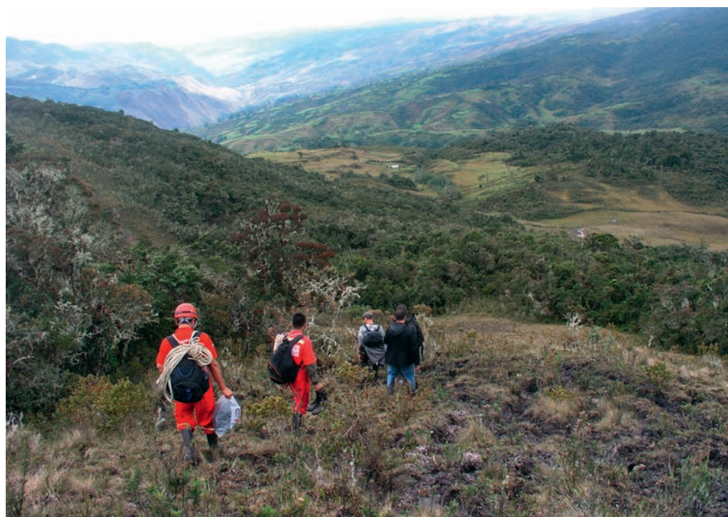
Photographie 18 : Descente dans la vallée du Río Atuen des équipes franco-péruviennes composées de spéléologues de l'ECA-GSBM et des secouristes de Nueva Cajamarca.

ou d'avoir prêté une assistance visible et réelle au blessé. Cependant, les résultats obtenus par l'équipe franco-péruvienne (GSBM / ECA) demeurent honorables et en même temps minimes comparés à ceux des équipes espagnoles dont l'investissement a été bien plus important. Pour eux, la solidarité relayée par les réseaux sociaux et l'indifférence affichée de leur gouvernement donnent à leur action une dimension héroïque. Lorsque Cecilio voit enfin le jour, les spéléologues espagnols laissent éclater leur joie. À cet instant précis, tous vivent un moment de communion intense : on aurait aimé être avec eux ce jour-là.