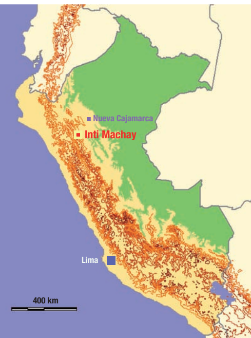
Figure 1: Carte du Pérou indiquant la situation de la cueva de Inti Machay (Leymebamba, Amazonas, Pérou) dans laquelle est survenu l'accident.