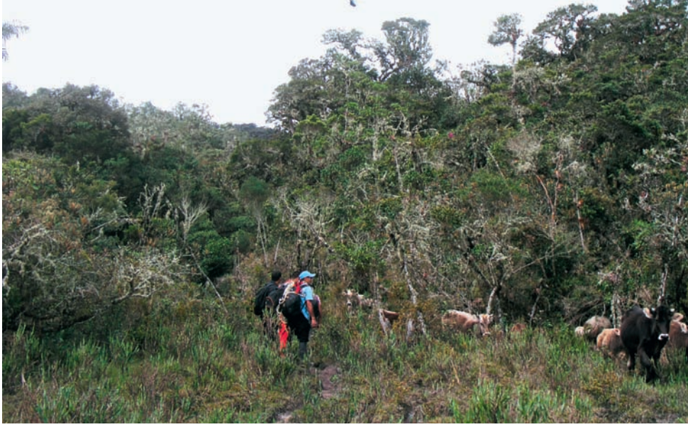
Photographie 1 : La Selva Alta est une forêt tropicale essentiellement arrosée par les nuages venant d'Amazonie qui s'accrochent aux premiers reliefs andins. Cette forêt s'étend notamment entre 2000 et plus de 3500 m d'altitude. On y trouve des arbres de toutes tailles, des orchidées, des broméliacées, des fougères, des mousses et des lichens; mais l'extension des pâturages (élevage bovin) tend à la faire disparaître.

de la région de Leymebamba (Amazonas) (figures 1 et 2).