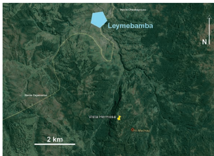
Figure 2: Situation du campement de Hermoso Horizonte et de la cueva de Inti Machay (Huriaca) près de la ville de Leymebamba (Amazonas, Pérou).