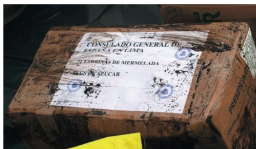
Photographie 12 : Les quelques colis envoyés par le consulat d'Espagne aux secouristes d'Inti Machay attestent des faibles moyens logistiques mis à la disposition des intervenants du premier secours spéléologique du Pérou.

Le reste de l'équipe descend au chevet du blessé et commence à installer les amarrages pour la tyrolienne et la traction de la civière (photographie 15).